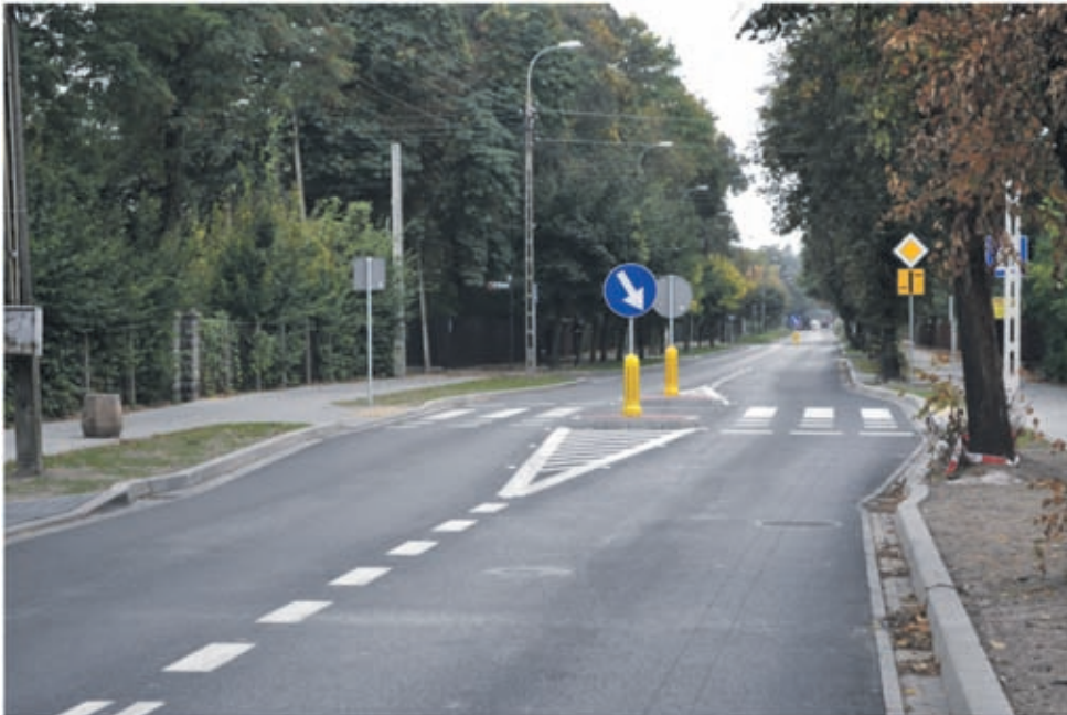
Przebudowany w 2011 r. odcinek ul. Grodziskiej w Brwinowie.

29 listopada br. Komisja oceniająca wnioski o dofinansowanie przebudowy dróg powiatowych oraz gminnych przedstawiła ostateczną listę rankingową wniosków o dofinansowanie zadań w ramach Narodowego Programu Przebudowy Dróg Lokalnych Etap II Bezpieczeństwo – Dostępność - Rozwój.